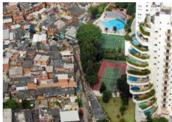
Nierówności w São Paulo, Brazylia.