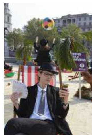
Kampania wymuszająca na brytyjskim rządzie zniesienie rajów podatkowych, londyński Plac Trafalgalski

1. Informuj: Przekazuj innym wiedzę na temat nierówności oraz zachęcaj do samodzielnego poszukiwania informacji i krytycznego podejścia do dostępnych informacji.